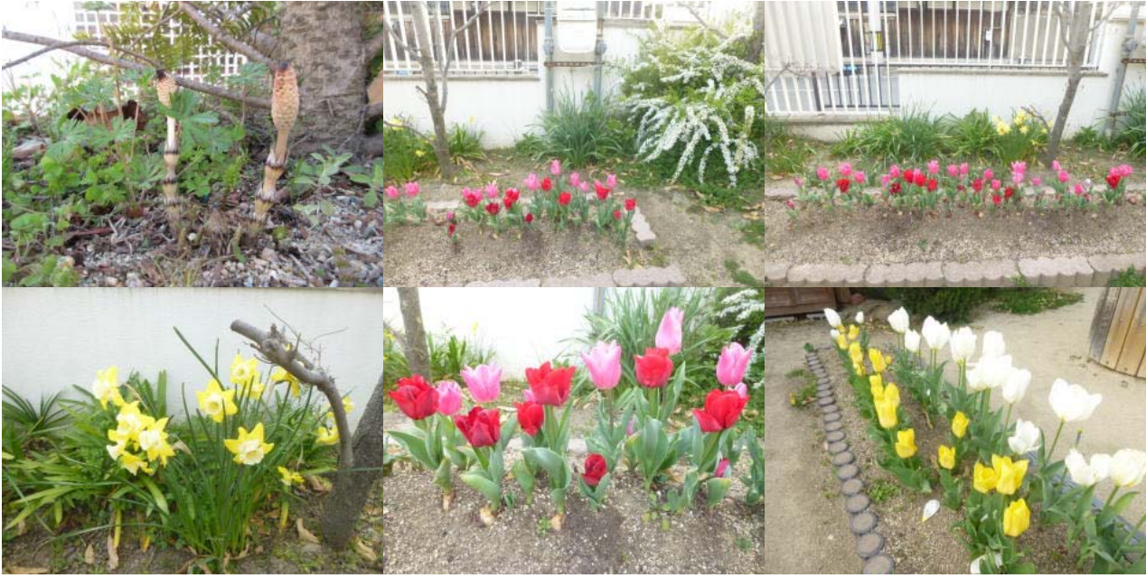
こどもたちが植えたチューリップが3月から4月にかけてこんなにきれいに咲きそろいました。 今年はずしも顔を出して、見つけたこどもたちも大喜び！