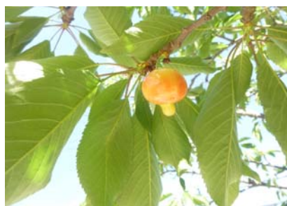
園庭では柿の木の赤ちゃんがたくさん実をつけ、桜の木にはおいしいそうなサクランボがおひさまの光を浴びて実っています。 年長さんはミトマトの苗を植えました。自分で置き場所を考えてそれぞれの場所に置き、毎日お世話をしています。 また、畑に小さな野菜の種をうえ、芽が出てきました。何の野菜ができるのか、お楽しみです。 きんかんの木の葉っぱにはちょうが卵を産み付け、小さな青虫が育っています。年少さんはケースに入れて毎日お世話をして何に変身するのかを楽しみにしています。